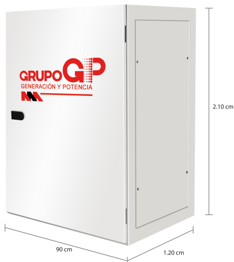
TABLERO DE CONTROL Y TRANSFERENCIA MCA GP TIPO AUTOSOPORTADO MODELO GP-D TIPO NEMA 1

El tablero de transferencia automático (alojado en gabinete ciego tipo NEMA1) modelo GP-500 (220V) con ATS doble tiro de 1600 Amp. tiene la función de hacer la transferencia y retransferencia de la carga de la red de CFE a la planta y viceversa, todo esto de forma automática o manual.