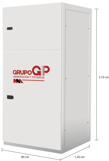
TABLERO DE CONTROL Y TRANSFERENCIA MCA GP TIPO AUTOSOPORTADO MODELO GP-E TIPO NEMA1

El tablero de transferencia automática (alojado en gabinete ciego tipo NEMA1) modelo GP-600 (220V) con ATS doble tiro de 2000 Amp. tiene la función de hacer la transferencia y retransferencia de la carga de la red de CFE a la planta y viceversa, todo esto de forma automática o manual.