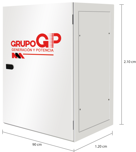
TABLERO DE CONTROL Y TRANSFERENCIA MCA GP TIPO AUTOSOPORTADO MODELO GP-D TIPO NEMA1

El tablero de transferencia automática (alojado en gabinete ciego tipo NEMA1) modelo GP-400 (220V) con ATS doble tiro de 1250 Amp. tiene la función de hacer la transferencia y retransferencia de la carga de la red de CFE a la planta y viceversa, todo esto de forma automática o manual.