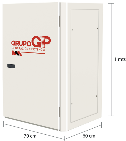
TABLERO DE CONTROL Y TRANSFERENCIA MCA GP CIEGO A PIE DE GENERADOR MODELO GP-C TIPO NEMA1

El tablero de transferencia automático (alojado en gabinete ciego tipo NEMA1) modelo GP-200 (220V) con ATS doble tiro de 630 Amp. tiene la función de hacer la transferencia y retransferencia de la carga de la red de CFE a la planta y viceversa, todo esto de forma automática o manual.