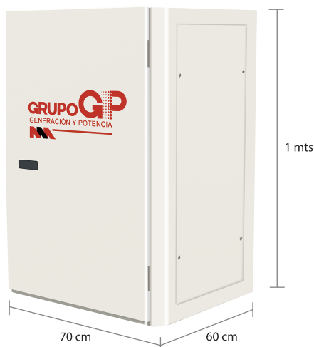
TABLERO DE CONTROL Y TRANSFERENCIA MCA GP CIEGO A PIE DE GENERADOR MODELO GP-C TIPO NEMA1

El tablero de transferencia automático (alojado en gabinete ciego tipo NEMA1) modelo GP-125 (220V) formado por transferencia doble tiro para 400 Amp. tiene la función de hacer la transferencia y retransferencia de la carga de la red de CFE a la planta y viceversa, todo esto de forma automática o manual.